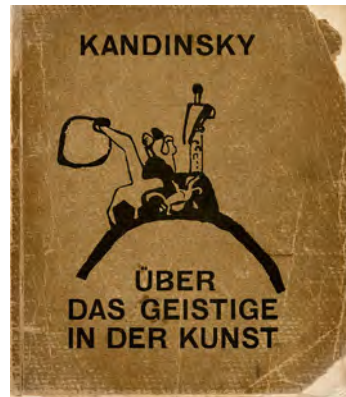
Historische Ausgabe, München 1911 (Piper)

Mommsen, Katharina , Die Entstehung von Goethes Werken in Dokumenten, Bd. 1, Abaldemus – Byron, Berlin 2006 (Walter de Gruyter)